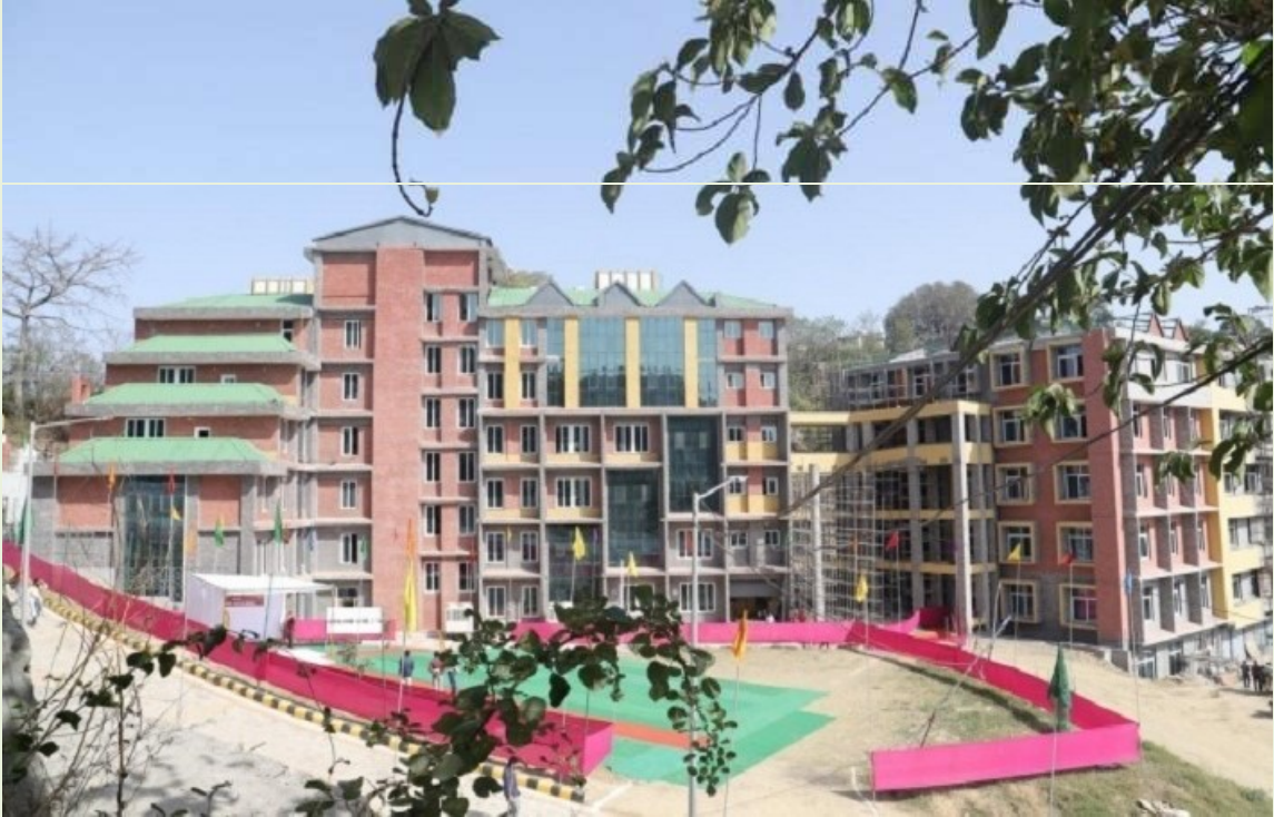
A View of H.P. Technical University Hamirpur

जिला सांख्यिकीय कार्यालय हमीरपुर हिमाचल प्रदेश